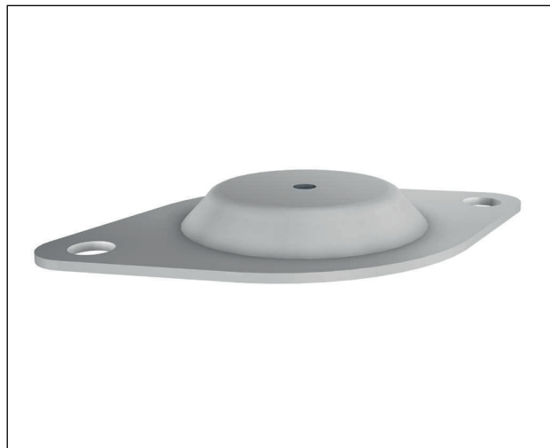
ISOTO P® FP, galvanised

Используйте наши знания в вопросах защиты от вибрации. Мы с радостью проконсультируем Вас и разработаем индивидуальное решение для виброизоляции.